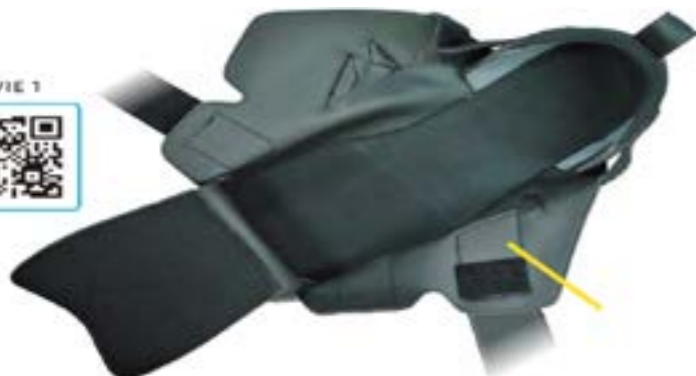
フルオープン (トランスフォーマータイプ)