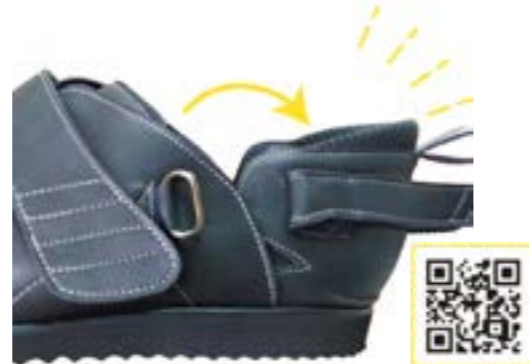
新機能 バックダウン型 (特許第 6765033 号)

シューホン型はもとより、ジレット継手型・タマラック型・オクラホマ継手型・金属支柱型・油圧制御継手型等あらゆる装具使用時に履くことが可能です。