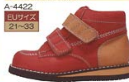
アップル×ビスケット