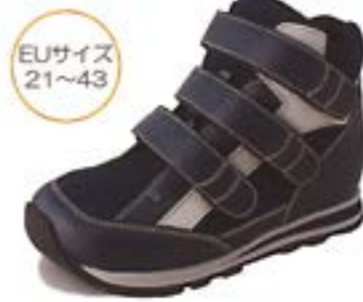
ネイビー/シルバー A-4416