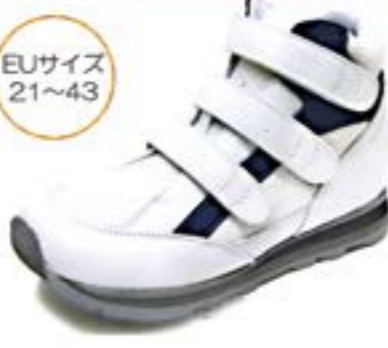
ホワイト/ネイビー A-4410