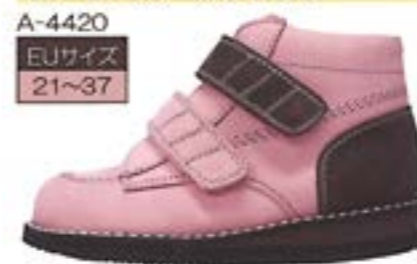
ストロベリー×ショコラ